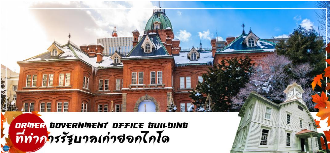
FORMER GOVERNMENT OFFICE BUILDING ที่ทำการรัฐบาลเก่าซอกไกโด

นำท่านเดินทางสู่ ย่านซุซุกิโนะ(Susukino) นับเป็นย่านที่เต็มไปด้วยแหล่งบันเทิงที่โด่งดังมากที่สุดของเมืองซัปโปโร(Sapporo) อีกทั้งยังเรียกได้ว่าเป็นย่านบันเทิงที่ใหญ่ที่สุดในทางตอนเหนือของญี่ปุ่นที่เดียวสะคะ บอกเลยว่าอยากมาบันเทิงใจยามค่ำคืนสัมผัสไลฟ์สไตล์แบบคนญี่ปุ่นแท้ๆ ต้องมาที่นี่ให้ได้เลยสะคะ เพราะเต็มไปด้วยร้านค้า บาร์ ร้านอาหาร ร้านคาราโอเกะ และตู้ปาจิงโกะ รวมกว่า 4,000 ร้าน บางร้านนี้เปิดจนถึงเที่ยงเที่ยงคืน